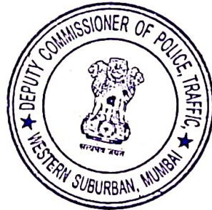
(Ajit Borhade) DCP Traffic (Western Suburbs) Mumbai City

Motorists traveling via Khar Subway are advised to use Milan Subway or Milan Flyover as alternate routes. Citizens are requested to cooperate with the Traffic Police and follow traffic instructions.