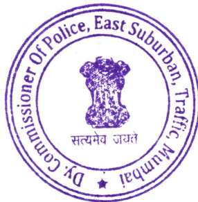
(Pradeep Chavan) Deputy Commissioner of Police, Eastern Suburb Traffic, Mumbai